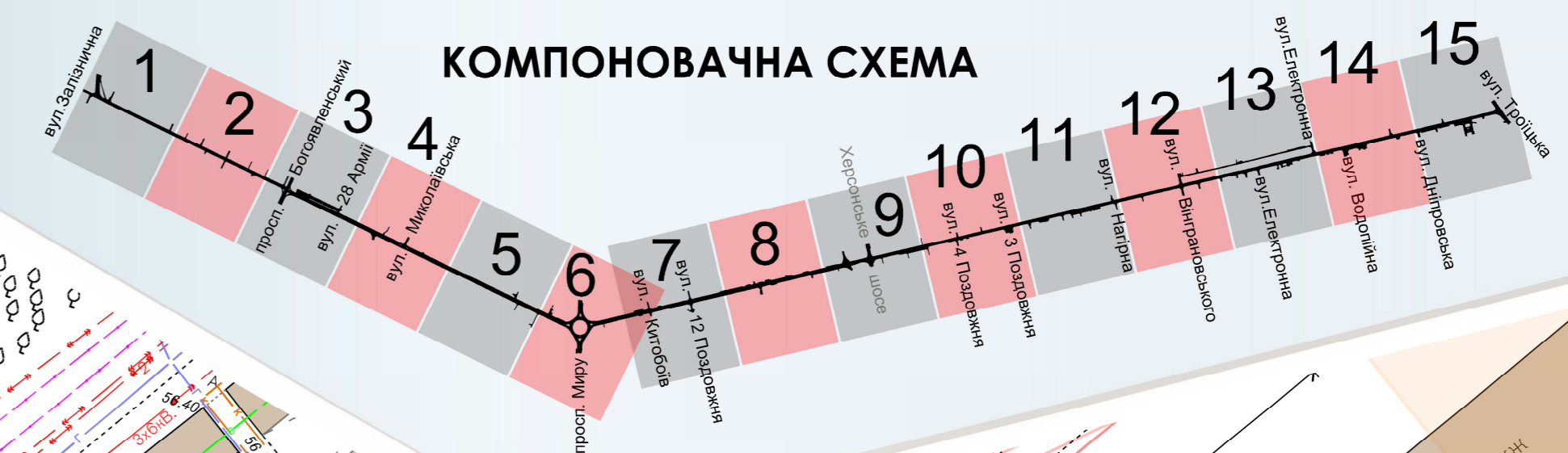
СХЕМА КОМПЛЕКСНОГО РОЗМІЩЕННЯ РЕКЛАМНИХ КОНСТРУКЦІЙ. М.1:500.