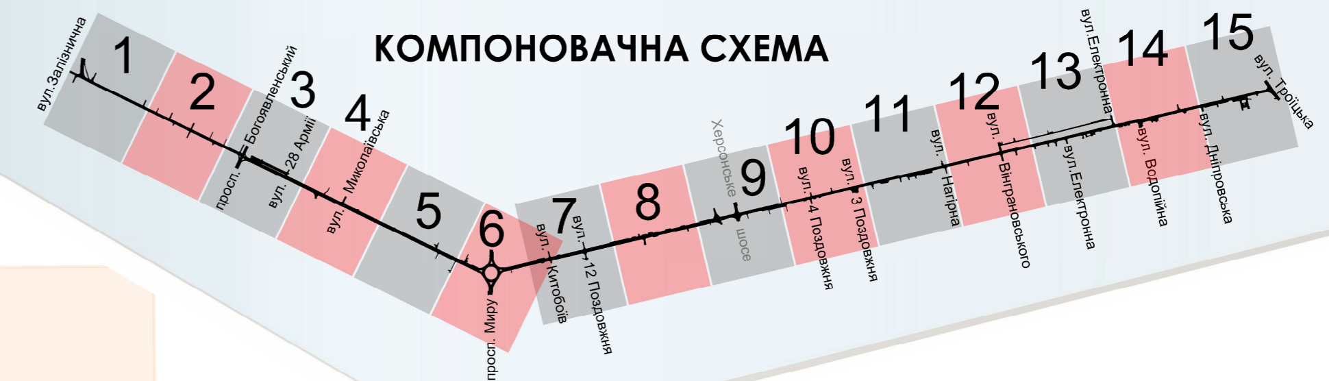
СХЕМА КОМПЛЕКСНОГО РОЗМІЩЕННЯ РЕКЛАМНИХ КОНСТРУКЦІЙ. М.1:500.