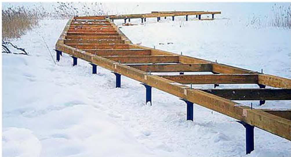
Елемент поля гвинтових паль

в) інші матеріали, суттєві для заявника проекту: